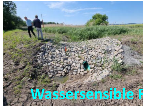
Wassersensible Flurgestaltung und Klimaanpassung

Was häufig fehlt, ist der Funke, dass Menschen vor Ort selbst wirksam werden können