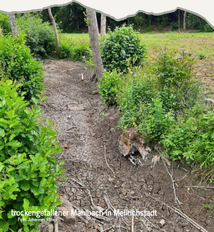
trockengefallener Mahlbach in Mellrichstadt

Gemeinsam mit uns erhalten neun weitere Regionen in Bayern Unterstützung, um zusammen mit lokalen Akteuren gezielt Projekte für die Schwammregion umzusetzen.